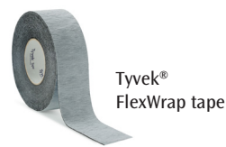
Tyvek® FlexWrap tape