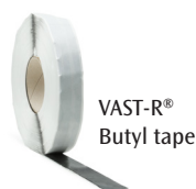
VAST-R® Butyl tape