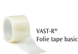
VAST-R® Folie tape basic