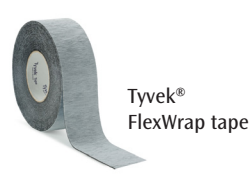
Tyvek® FlexWrap tape