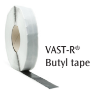
VAST-R® Butyl tape