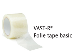
VAST-R® Folie tape basic